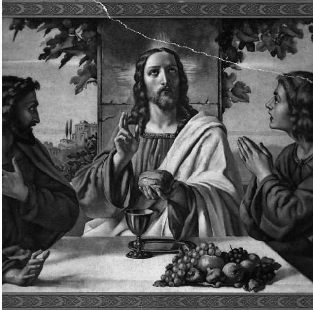
Abb. 140 Jesus

Bei Jesus und Buddha handelte es sich um zwei erleuchtete Menschen, die die wahre Natur der Phänomene und das Nichts erlebten, aus dem alles hervorgeht und in das alles wieder eingeht. Die unterschiedliche bildliche Darstellung ist äußerst aufschlussreich. Jesus wird in unserer Kultur oft mit einem Himmelwärtsblick dargestellt, der in die Ohnmacht, ins Koma oder in den Tod führen könnte. Der Blick gen Himmel ist einseitig und