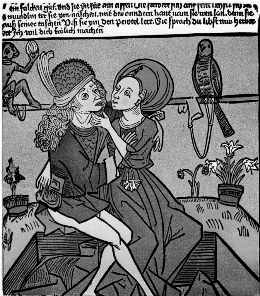
Abb. 26 Renaissancepaar mit exotischen Tieren